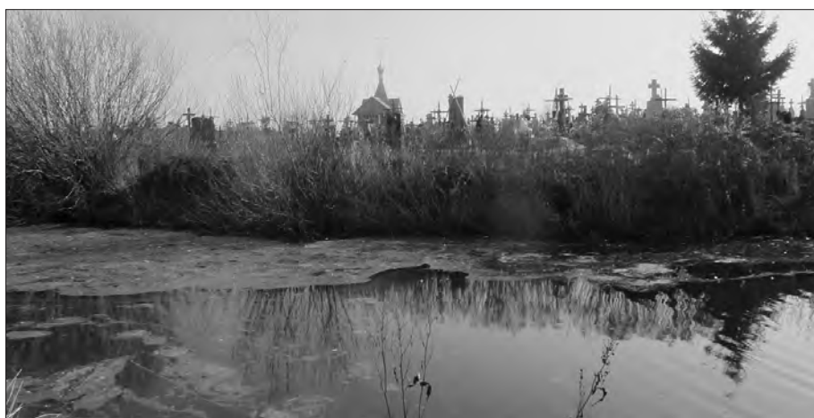
Меліоративний канал проходить майже впритул до кладовища. Фото зроблено 29 березня 2016 року. Зазначимо, що водопілля тієї весни на Волині було незначним. У проектах новий цвинтар існує вже майже десять років, але виділена під нього площа виявилася непридатною для проведення захоронень.

Але навесні 2016-го, коли знову довелось побувати в Заболотті, ситуація не змінилася. Лише поруч із цвинтарем викопали глибокий широкий