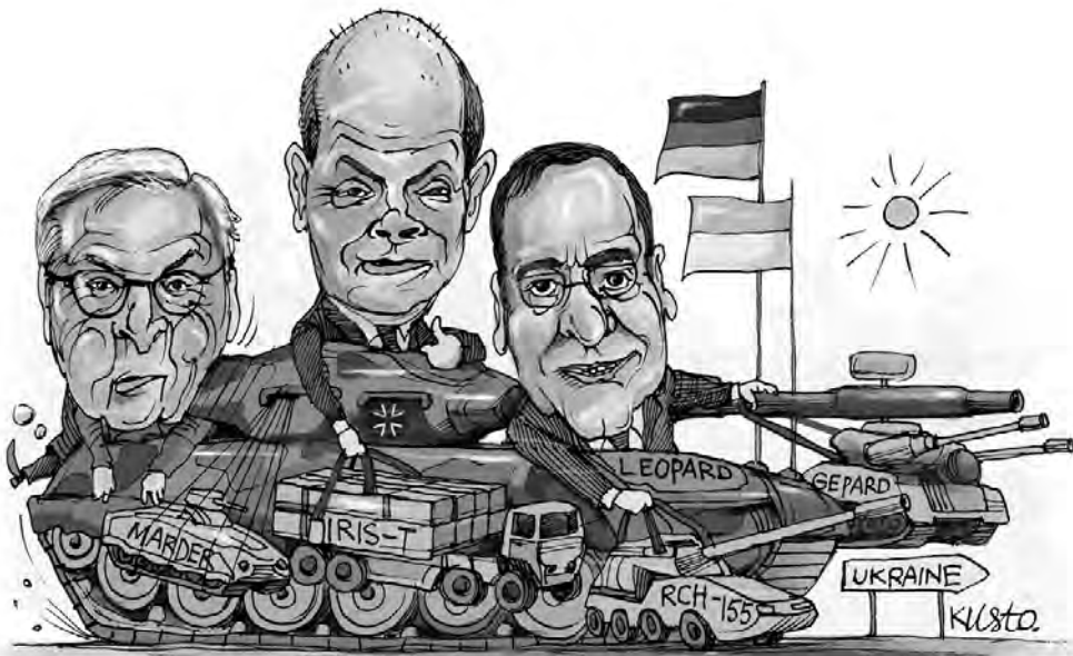
Дякуємо Німеччині за найбільший з початку війни пакет військової допомоги.